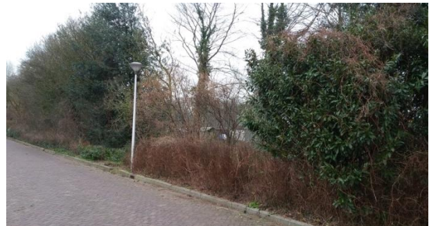
het oude uitzicht

Nu is het begin juni, de meteorologische zomer is net begonnen en de bomen en struiken staan vol in het blad. Het is een lust voor het oog om volop te genieten van het nieuwe uitzicht! En het wordt natuurlijk steeds voller en groener en de huisjes en kasjes zijn nu nog te zien maar volgend jaar heb ik vast weer een onbelemmerd groen uitzicht! Wat ik leuk vind is het komen en gaan van ijverige tuinhobbyisten die genieten van hun liefhebberij en die mogen hun auto ook best voor mijn deur parkeren als ze mijn oprit maar niet blokkeren. Alvast dank!